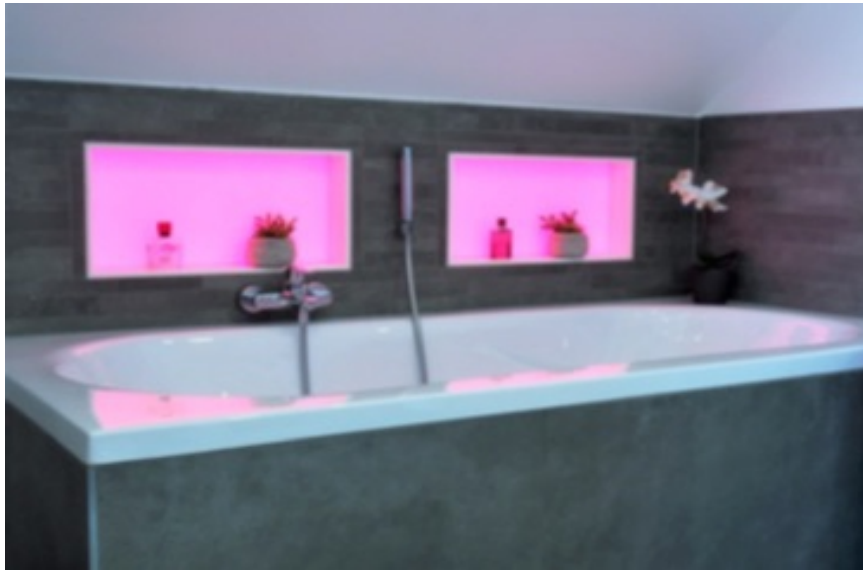
(BU Foto 1): Element einer stimmungsvollen Inszenierung der Wohlfühloase Bad - die vollflächig leuchtende Wandnische illuminet®.