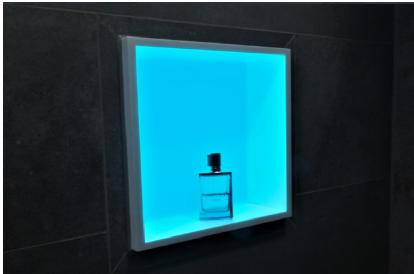
(BU Foto 2): Ästhetik und Funktion: illuminet® 30 mit individuell einstellbarem Farbwechsel.